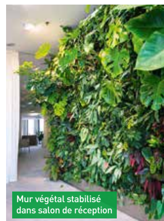
Mur végétal stabilisé dans salon de réception