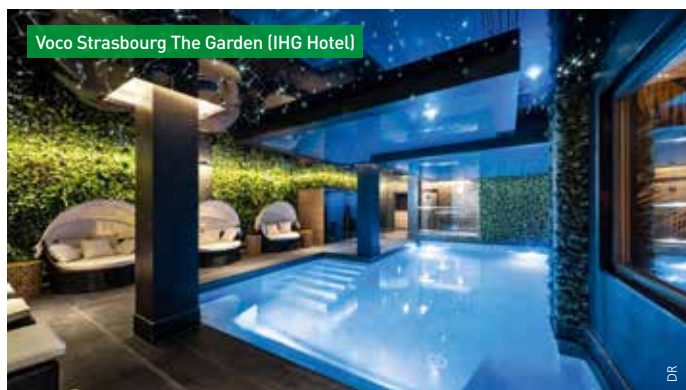
Voco Strasbourg The Garden (IHG Hotel)

Parmi les établissements qui ont placé la nature au cœur de leur concept, voco Strasbourg The Garden (IHG Hotel) . Pièce maîtresse du quatre-étoiles, le patio central pensé par le paysagiste Gabriel Milochau qui a travaillé en étroite collaboration avec l'architecte qui a conçu l'intérieur de l'hôtel (cabinet Architecture Concept). Une approche qui se retrouve en intérieur avec des murs végétaux omniprésents dans la salle de réunion, salle de restaurant, lobby, spa/piscine... pour renforcer la sensation de bien-être.